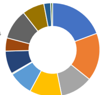
Répartition par secteur